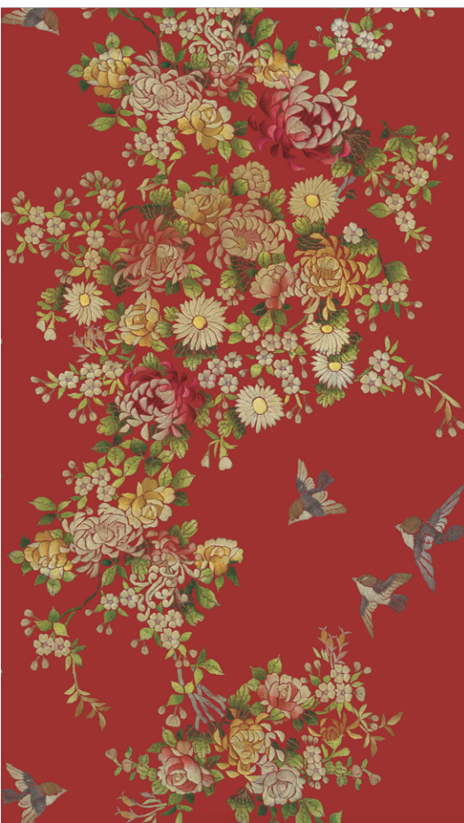
TREE OF LIFE P 13/55