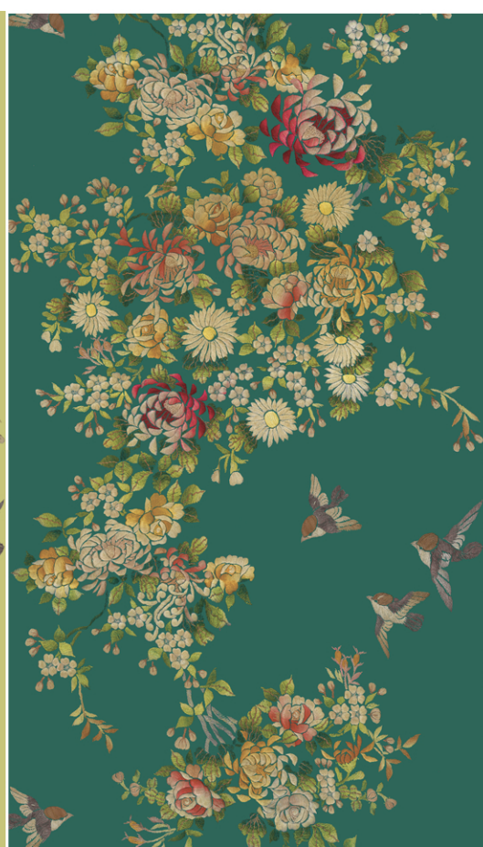
TREE OF LIFE P 13/57