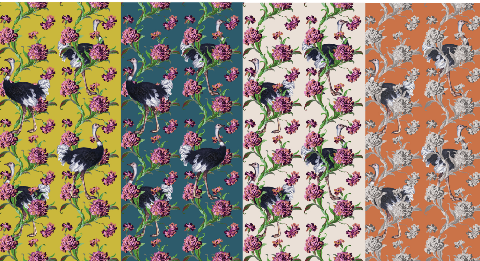
OSTRICH P 02/41

Il tessuto è disponibile in larghezza 140 cm per l'altezza che più si desidera.