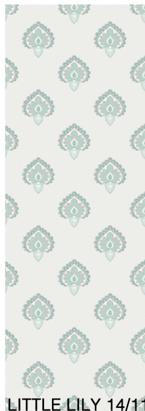
LITTLE LILY 14/11