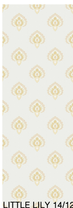
LITTLE LILY 14/12