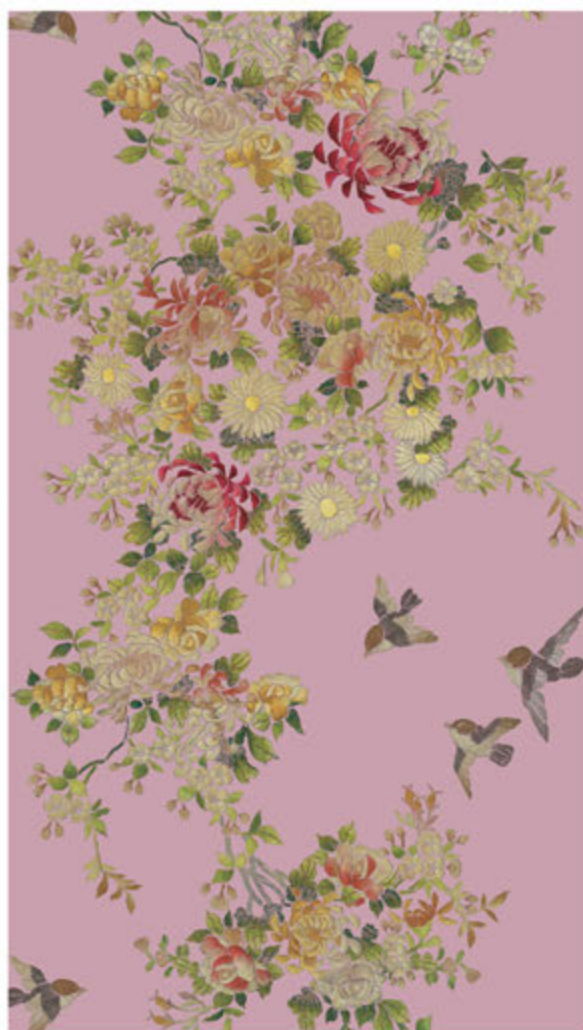
TREE OF LIFE P 13/53