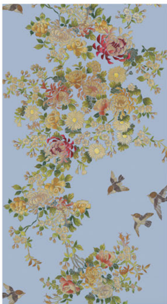
TREE OF LIFE P 13/54