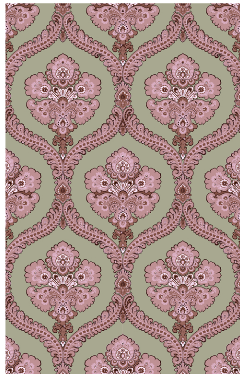
DAMASK P 01/33