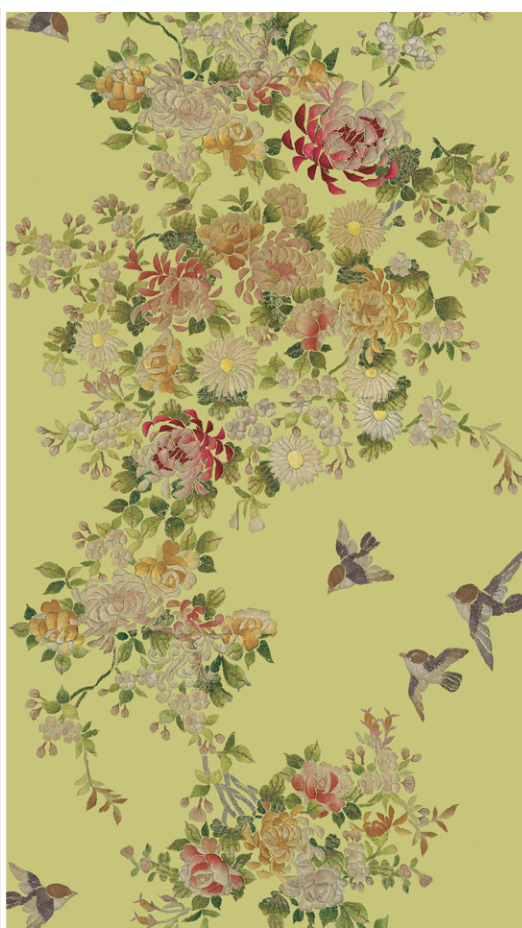
TREE OF LIFE P 13/56