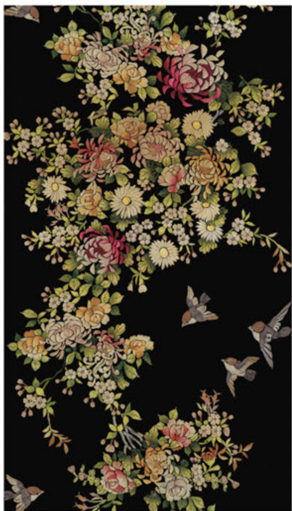
TREE OF LIFE P 13/51

La larghezza del tessuto è di 140 cm per un'altezza che meglio si adegua alle esigenze del cliente.