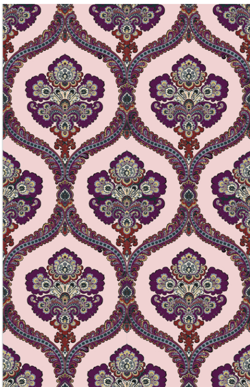
DAMASK P 01/31

Questi tessuti hanno una larghezza di 140 cm, e si sviluppano nell'altezza che più si desidera.