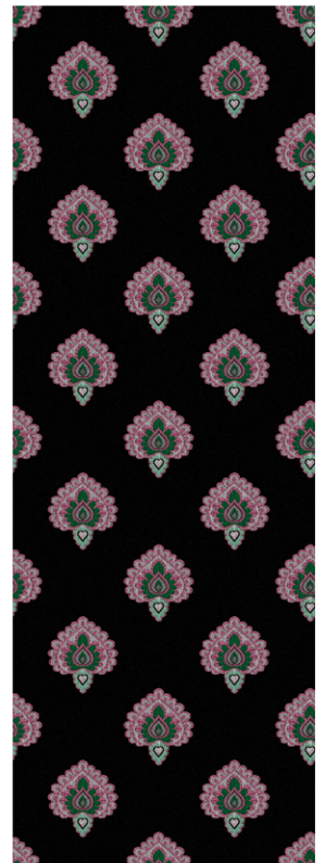
LITTLE LILY 14/10