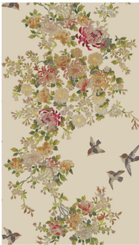
TREE OF LIFE P 013/52